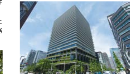
東京スクエアガーデン