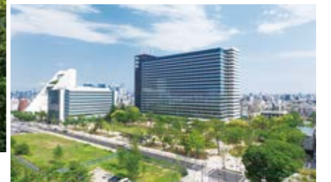
中野セントラルパーク