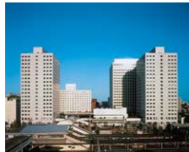
大崎ニューシティ

土地取得競争が激しさを増す中、総合不動産会社としての総合力を活かし、大崎駅東口再開発事業に参画。1987年に「大崎ニューシティ」を竣工させ、大規模都市再開発事業のノウハウを蓄積。 定期借地権付き分譲マンションや免震マンションの開発、日本初の不動産証券化商品の開発など、より高度な取り組みにも挑戦。