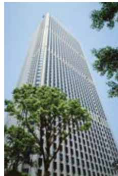
新宿センタービル

日本経済の発展に伴いオフィスへの需要が高まる中、オフィスビル事業を積極的に拡大。1979年に新宿副都心のランドマークとなる大規模プロジェクト「新宿センタービル」を完成。 高度成長期の住宅不足を受けて分譲マンション事業に進出。また、これらの用地の取引需要を応えるため、仲介事業にも参入し、総合不動産会社として事業を拡大。