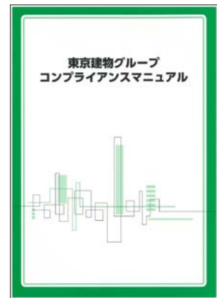
コンプライアンス マニュアル

コンプライアンスマニュアルは冊子にして、グループ会社の職場で業務に従事する全ての従業員に配布または事業所ごとに掲示し、周知・徹底を図っています。