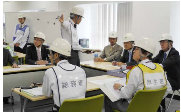
震災対策共同訓練の様相