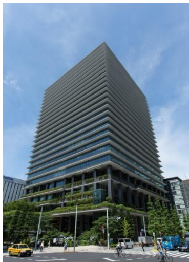
東京スクエアガーデン